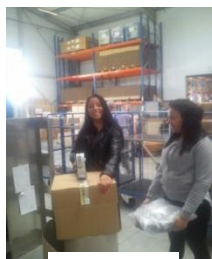
Horn & Bauer Unternehmensgruppe