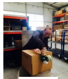
Horn & Bauer Unternehmensgruppe