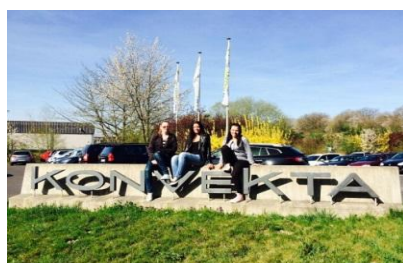
KONVEKTA Technical leadership starts with ideas.